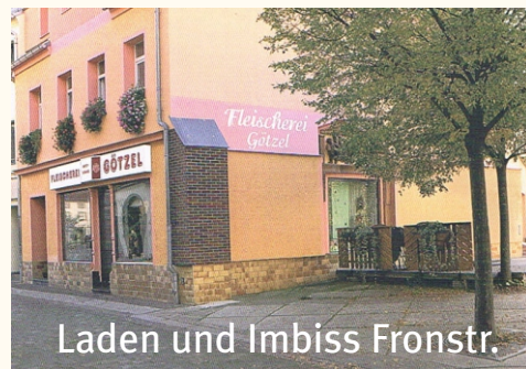
Laden und Imbiss Fronstr.

5% Kundenrabatt im Partyservice A photograph of several skewers of food. Each skewer has a round slice of melted cheese on top of a cherry tomato. The skewers are arranged in a cluster, with some green basil leaves and a drizzle of brown sauce in the background.